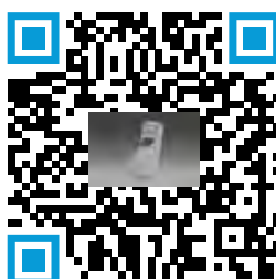
Inhalador de Aerosol Redihaler