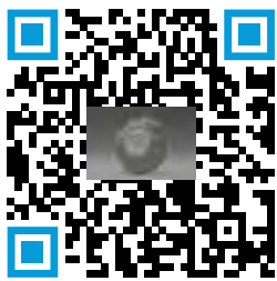
Inhalador de Polvo Seco Diskus