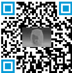
Inhalador de Polvo Seco Ellipta