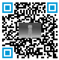
Inhalador RespiMat Softmist