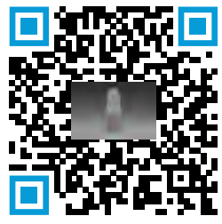
Inhalador de Polvo Seco Twisthaler