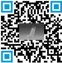
Inhalador de Dosis Medida