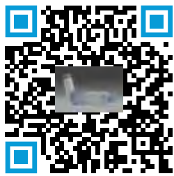
Inhalador de Dosis Medida con Espaciador