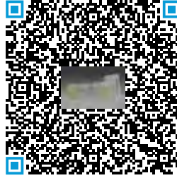
Espaciadores y cámaras de retención con válvulas