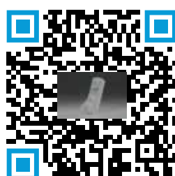
Inhalador de Polvo Seco RespiClick